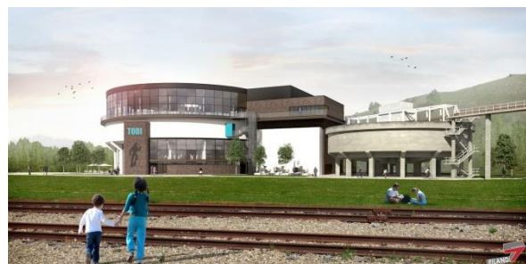
Beelden : EILAND7 Architecten

Bezoekers komen langs een buitentrap in een gang waar ze via ramen een kijkje kunnen nemen in het duikbassin. Als ze verder de trap opgaan, komen ze op het platform rond het duikbassin waar de