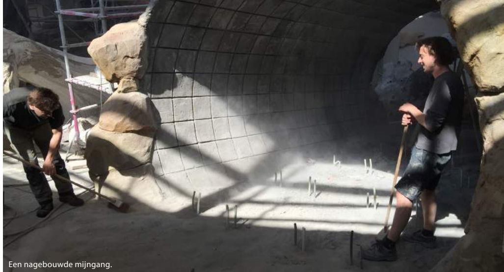
Een nagebouwde mijngang.

Behalve lood, trimvest en duikfles, zal je er met je eigen duikmateriaal kunnen duiken. De juiste formule is nog niet uitgewerkt,