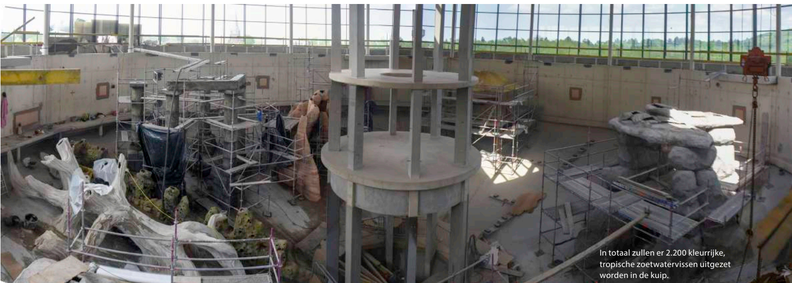
In totaal zullen er 2.200 kleurrijke, tropische zoetwatervissen uitgezet worden in de kuip.