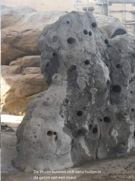
De vissen kunnen zich verschuilen in de gaten van een muur.

waterleven in het duikbassin. Daarnaast hebben bezoekers de mogelijkheid om via ramen naar de duikers te kijken.